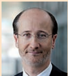
Neue Kommunikationstechnologien / Grossunternehmen