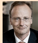
Unternehmensprüfung- und beratung

Global Head Diversity & Inclusion, Swiss RE