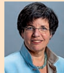
Politik / Familienlobby